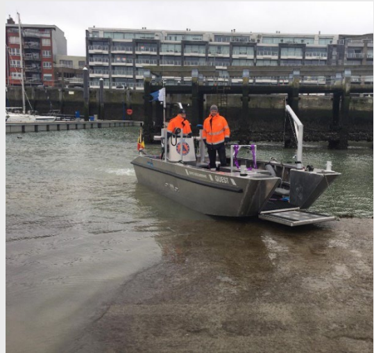
Le 3015, bateau pour la reconnaissance. Plus maniable que le 3012, il est muni d'un petit sonar qui permet de retrouver un véhicule