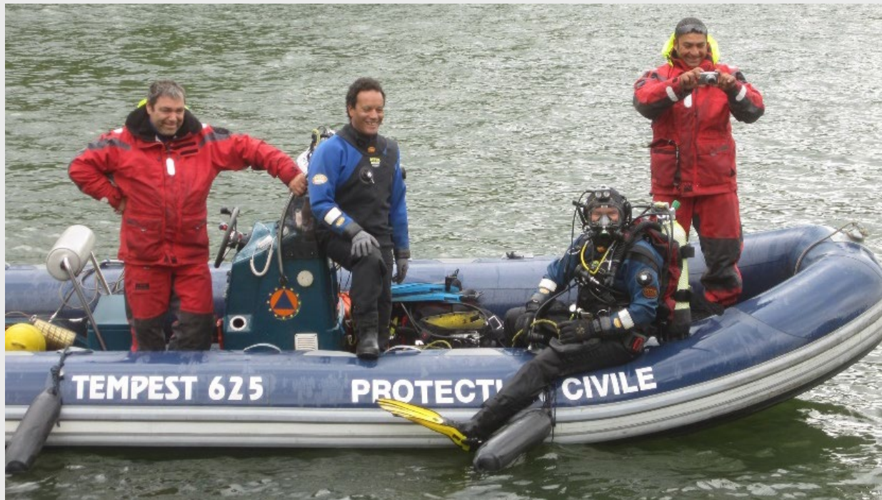
Le zodiac à moteur électrique pour le travail sur les étangs