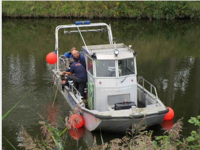
Le plus vieux des bateaux en activité est le 3012 dit l'Incevable, bateau à fond plat conçu à l'origine pour les poches à huîtres sur l'île d'Oléron. Il a été transformé pour le travail d'extraction de véhicule